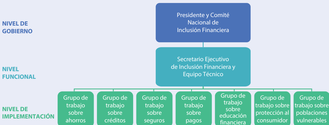
FIGURA 3. Marco de apoyo a la implementación

Es importante involucrar lo antes posible a las principales partes interesadas, especialmente del sector privado, y lograr que participen durante todo el proceso. El equipo y las autoridades reconocen que las consultas de base amplia con las partes interesadas son importantes para obtener perspectivas valiosas y para generar adhesión y apoyo al proceso. El público en general y los sectores privado y público estuvieron involucrados desde la etapa inicial de recopilación de datos y diagnóstico. Se realizaron encuestas de muestras representativas de la población para determinar el tipo y el nivel de servicios financieros demandados. Se llevaron a cabo entrevistas con proveedores de servicios financieros, para analizar la oferta de esos servicios, y con organismos reguladores. Una vez redactadas las notas técnicas y la versión preliminar de la estrategia, se invitó a un extenso grupo representativo de las partes interesadas a participar en un foro con el objeto de formular comentarios sobre la estrategia, que se había distribuido previamente. Las partes interesadas incluyeron organizaciones del sector privado, entre ellas bancos,