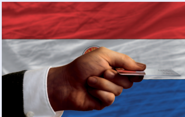
© Vepar5. Se requiere autorización adicional para volver a utilizarla.

En la estrategia se debe poner el acento en la implementación, así como incluir un claro plan de acción y un marco sólido de monitoreo y evaluación. En Paraguay, las autoridades elaboraron un conjunto de medidas prioritarias que debían implementarse dentro de los plazos establecidos. El plan de acción contiene indicadores clave de desempeño (véase el anexo I) que abarcan alrededor de 60 acciones de política distribuidas entre siete grupos de trabajo. Cada acción de política incluye una clara descripción de la tarea, su nivel de prioridad y la fecha aproximada en la que debería estar finalizada. Las medidas de política se concertaron a través de un proceso de consulta para generar consenso, que incluyó a representantes de los sectores público y privado y a otras partes interesadas clave.